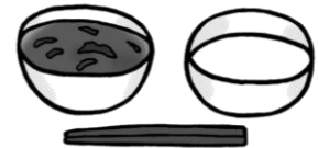
ミルク(脱脂粉乳)、トマトシチュウ